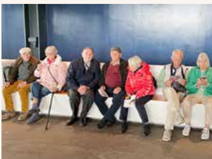
Erstmal Pause nach der Anreise.

Historische Aufnahme der Zeche Zollverein in Essen – Einst das Herz der Steinkohleförderung im Ruhrgebiet.