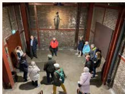
Wir lauschen den Ausführungen unserer fachkundigen und kompetenten Führerin (II).