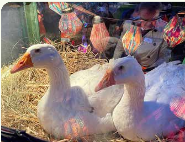
Gans gut, dass wir dabei sind!

Not macht nicht nur erfinderisch, sondern endet manchmal sogar gemütlich. Da die Tribüne auch in diesem Jahr noch ihre wohlverdiente Ruhepause braucht, bleibt der Abschluss am Vereinsheim. Warum auch nicht? Schließlich war das „Ende vom Lied“, dass die neue Position eigentlich viel uriger war.