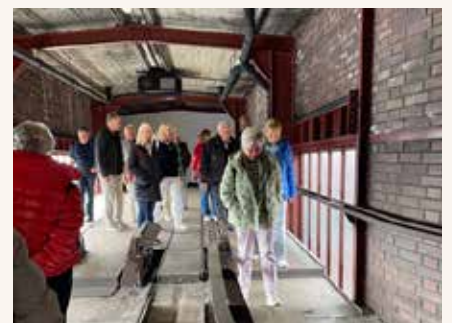
Auf abenteuerlichen Pfaden durch die alten Hallen.