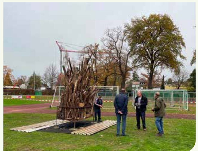
Der neue Feuerplatz und die (Feuer-)Macher.